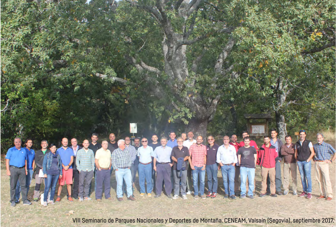
VIII Seminario de Parques Nacionales y Deportes de Montaña. CENEAM, Valsain (Segovia), septiembre 2017.

N uestro sistema de parques nacionales es ya centenario, pues la primera Ley de parques nacionales, pionera a nivel mundial, data de 1916. Posteriormente, en 1918, se declararon nuestros primeros parques nacionales, el de la Montaña de Covadonga, en la actualidad de los Picos de Europa, y el del Valle de Ordesa, actualmente ampliado a Ordesa y Monte Perdido.