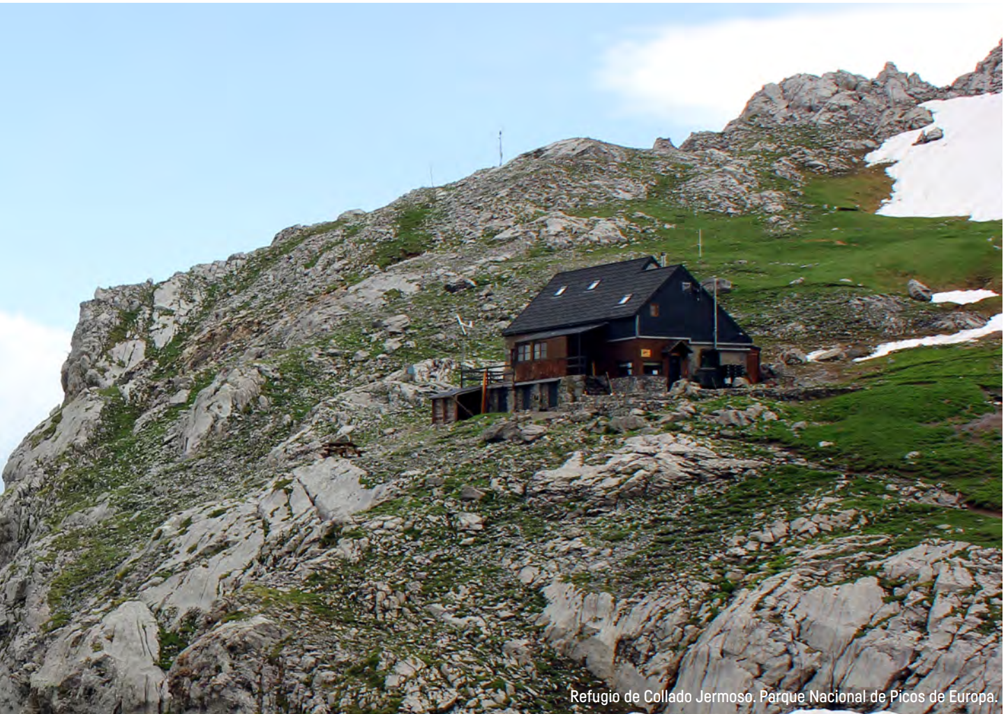
Refugio de Collado Jermoso. Parque Nacional de Picos de Europa.

En 2007, del 20 al 22 de abril, se celebró en Covadonga el IV Seminario de Espacios Naturales Protegidos y Deportes de Montaña, participando representantes de Federaciones de Montañismo y Gestores de Espacios Naturales Protegidos, pertenecientes a 12 Comunidades Autónomas. La mesa técnica sobre “Barranquismo en Espacios Naturales Protegidos” abordó un trabajo similar al planteado dos años antes sobre la escalada, si bien en este caso se afrontaba la solución a problemas localizados en lugares concretos de pocas comunidades autónomas. La mesa técnica sobre “Montañismo y educación ambiental” partió del acuerdo de que el montañismo ha estado ligado desde sus orígenes a un deseo de explorar y conocer el medio natural mediante la práctica de una actividad deportiva cuya esencia pasa por el respeto a la naturaleza y el aprendizaje de valores y actitudes que conducen al compromiso de los montañeros con la educación ambiental.