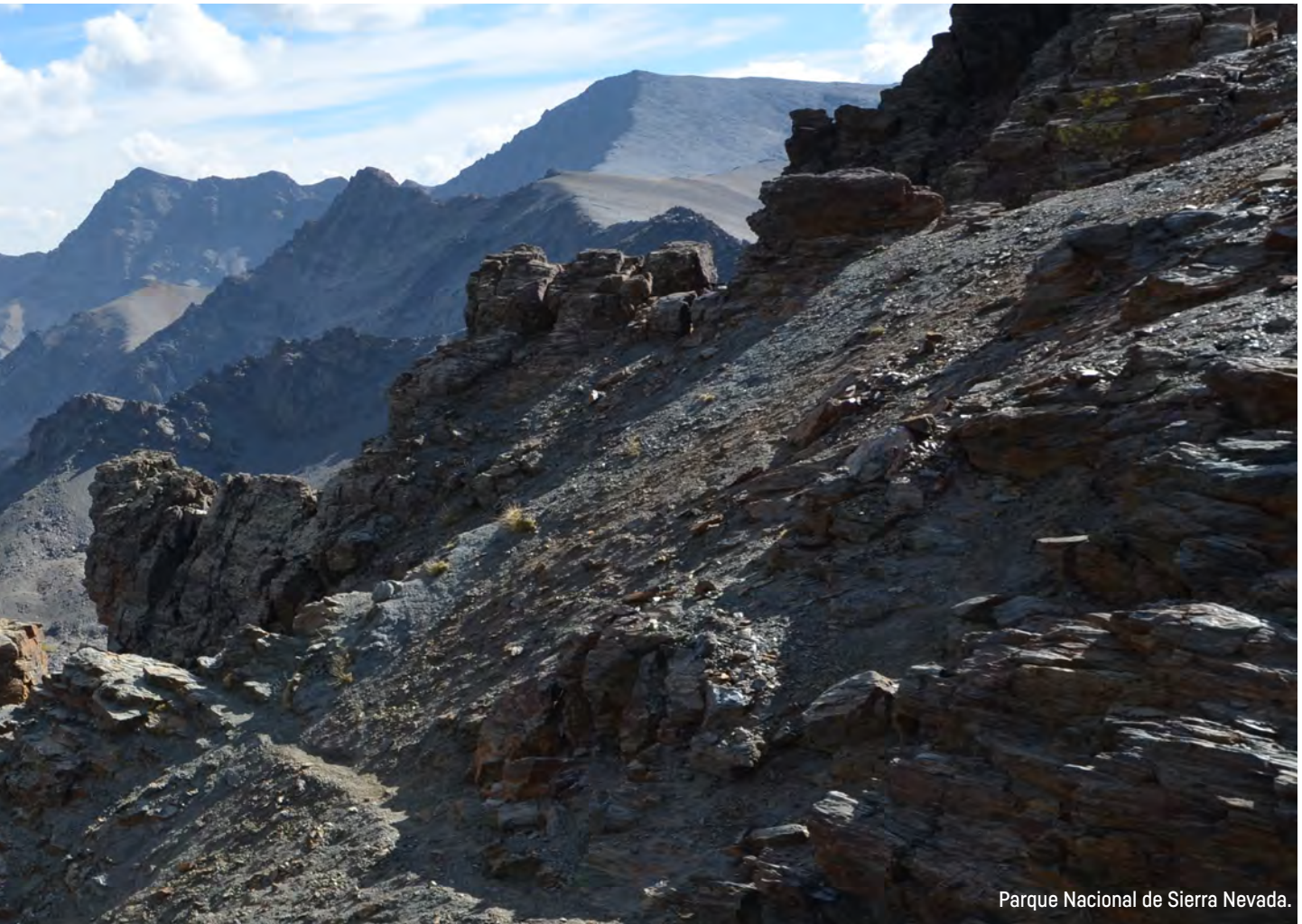
Parque Nacional de Sierra Nevada.

so uno o dos documentos y se tradujeron al inglés, ya que esta fórmula de trabajo es hoy día un referente internacional.