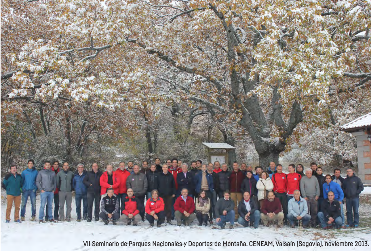
VII Seminario de Parques Nacionales y Deportes de Montaña. CENEAM, Valsaín (Segovia), noviembre 2013.

D esde hace ya 18 años y de la mano del Comité de naturaleza, accesos y refugios de la FEDME, contando siempre con la colaboración del Organismo Autónomo Parques Nacionales, se han venido celebrando de manera bianual los Seminarios de Espacios Naturales Protegidos y Deportes de Montaña. Esta iniciativa ha conseguido, lógicamente, estrechar las relaciones de colaboración entre los gestores de espacios naturales protegidos y los representantes de los montañeros, usuarios naturales y asiduos de estos espacios. El éxito de los acuerdos y conclusiones a las que se ha ido llegando han sido espectaculares.