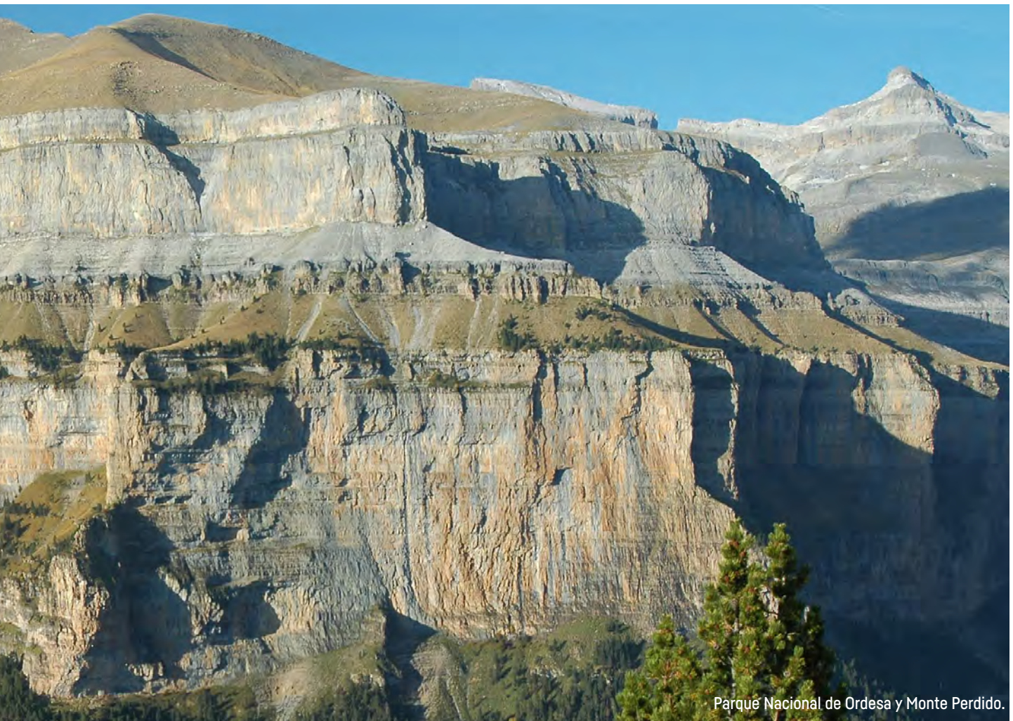
Parque Nacional de Ordesa y Monte Perdido.

natural. El documento establece unas líneas maestras que constituyen el compromiso entre montañeros y gestores medioambientales en materia de seguridad.