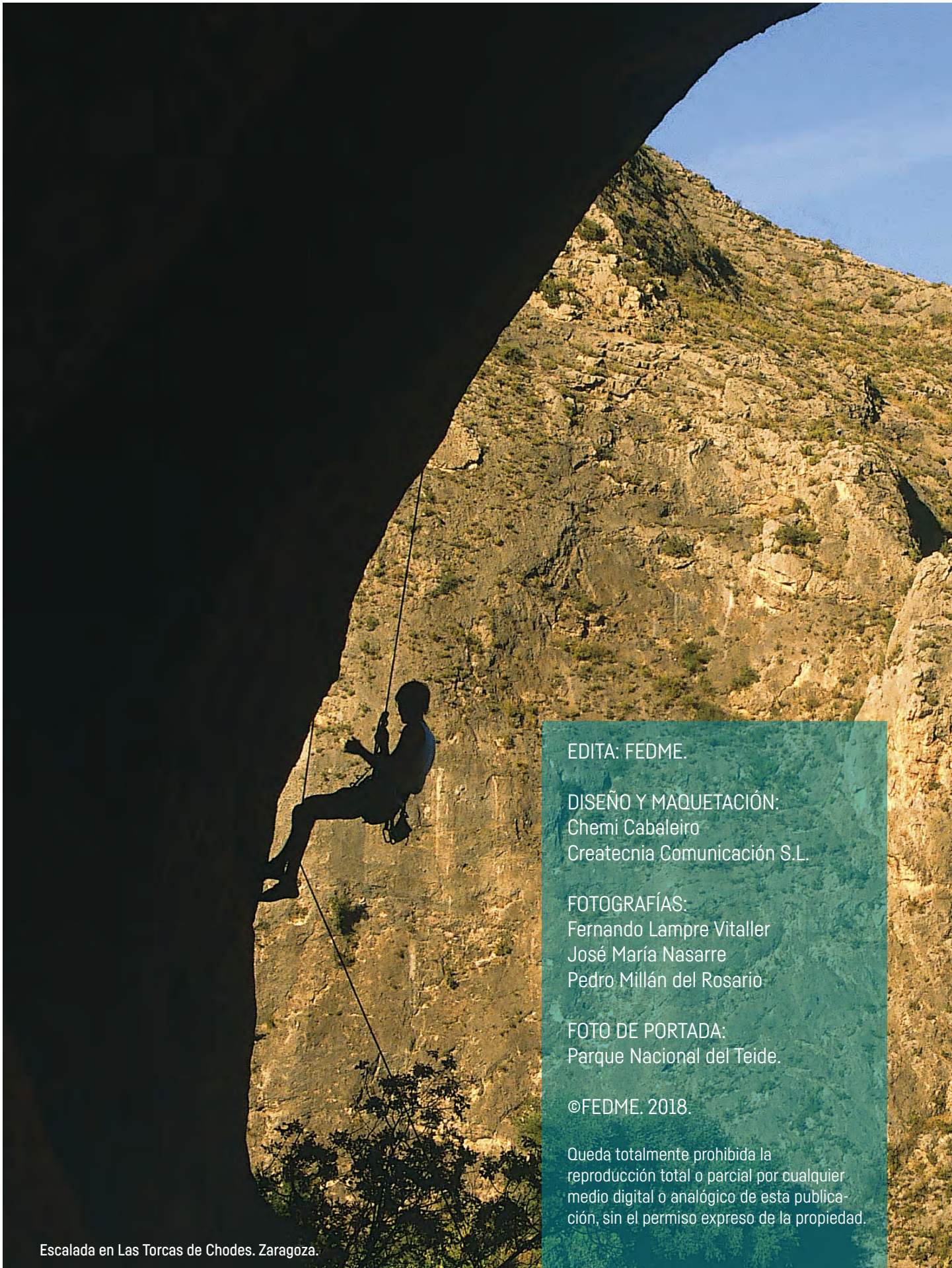
Escalada en Las Torcas de Chodes. Zaragoza.