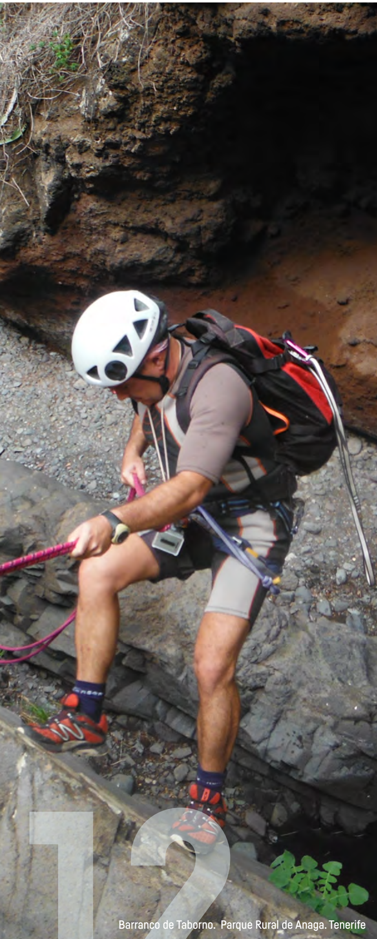
Barranco de Taborno. Parque Rural de Anaga. Tenerife