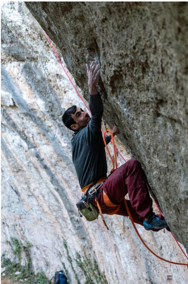
Video - La pequeña Mowgli

Ya cuento con varias ascensiones en solo integral. Entre ellas, ya escalé otras dos vías de más o menos la misma dificultad: “Kundalini” (8c) y “Darwin Dixit” (8c). Esta primera, ya se convirtió en la ruta más difícil del mundo escalada sin cuerda, ya que en la actualidad, lo más duro escalado en este estilo por otra persona es 8b+.