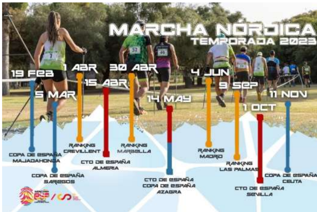
Imagen 1: “Calendario nacional de competiciones de Marcha Nórdica”

Además, tendremos presente el Campeonato de España CADEBA , es decir, el que reúne a los/las niños/as en edad escolar que practican Marcha Nórdica en toda la geografía española.