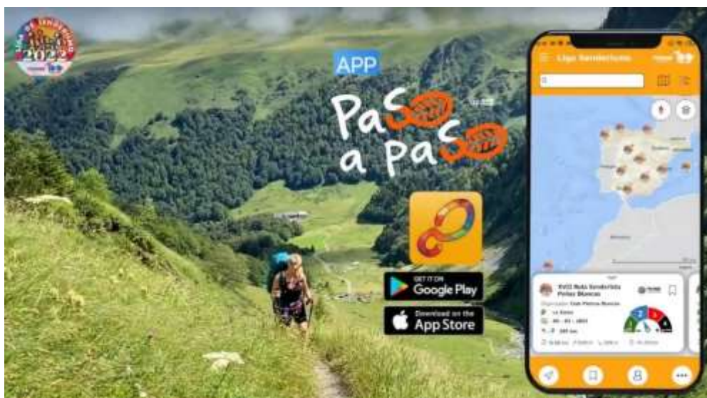
Imagen 2: “APP Paso a Paso de la FEDME”

Las inscripciones estarán gestionadas para la APP “Paso a Paso”, que gestiona directamente la FEDME, ya que estas no son libres sino con invitación directa por cada Federación Autonómica presente en ambos campeonatos.